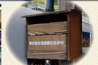
動き出した「地域商社がの」